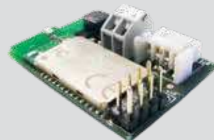
B-EBA Tieša saite uz jūsu operatoriem.

Vai ar U-Link var savienot tādus operatorus, kas nav oriģinālie U-Link Bft operatori, kā arī citu zīmolu izstrādājumus? Jā, šo iespēju nodrošina Clonix uztvērēji. Piederumi ar nelierobežotu pieņemšanu.