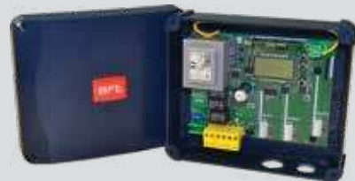
Clonix U-Link Savienojiet ar U-Link sistēmām neoriģinālo U-Link un neoriģinālos Bft izstrādājumus.

U-SDK ir lietojumprogramma, kas ļauj izveidot saderīgas Bft automatizācijas un tās viegli integrēt ar BMS tīklu.